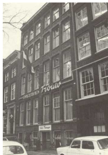
Het pand aan de Postzegelmarkt waar de Trouw-redactie van 1965 tot 1976 was gehuisvest.