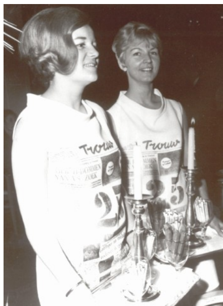
‘Trouw in het zilver’ . Op de receptie bij het vijftienvigjarig bestaan van de krant.

Ook de fusie met De Rotterdammer kon Trouw niet redden. Omdat de door Bruins Slot getoonzette evangelische progressiviteit het in de nieuwe krant won van het behoedzame en behoudende redactionele beleid dat Diemer had gevoerd, liepen orthodoxe Rotterdammer -lezers massaal weg. Terwijl het aantal Trouw -abonnees zich rond de 100000 stabiliseerde, liep het Kwartetsegment terug van 95000 naar 68000. Van de opzeggers zocht het merendeel zijn heil bij het Reformatorisch Dagblad , dat in 1973, twee jaar na de oprichting, al rond de 30000 abonnees telde. ‘De kerkelijk en politiek meer