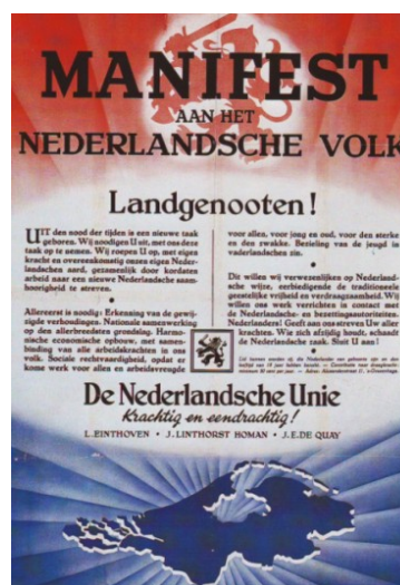
Het manifest van de Nederlandse Unie, 24 juli 1940

Deze continuïteit eist dat de Volkseenheidconferenties en de daaruit voortgekomen bewegingen een voorname plaats krijgen in de geschiedschrijving van de Nederlandse Unie. Niet om het in sommige opzichten bedenkelijke beleid van de Unietop te vergoelijken, maar omwille van de historische volledigheid.